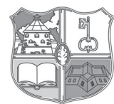
Шлиссельбургская городская библиотека им. поэта М.А. Дудина

Добраться до митинга также можно на микроавтобусе от здания администрации Кировского района (Кировск, ул. Новая, д. 1). Время отправления – 11:30.