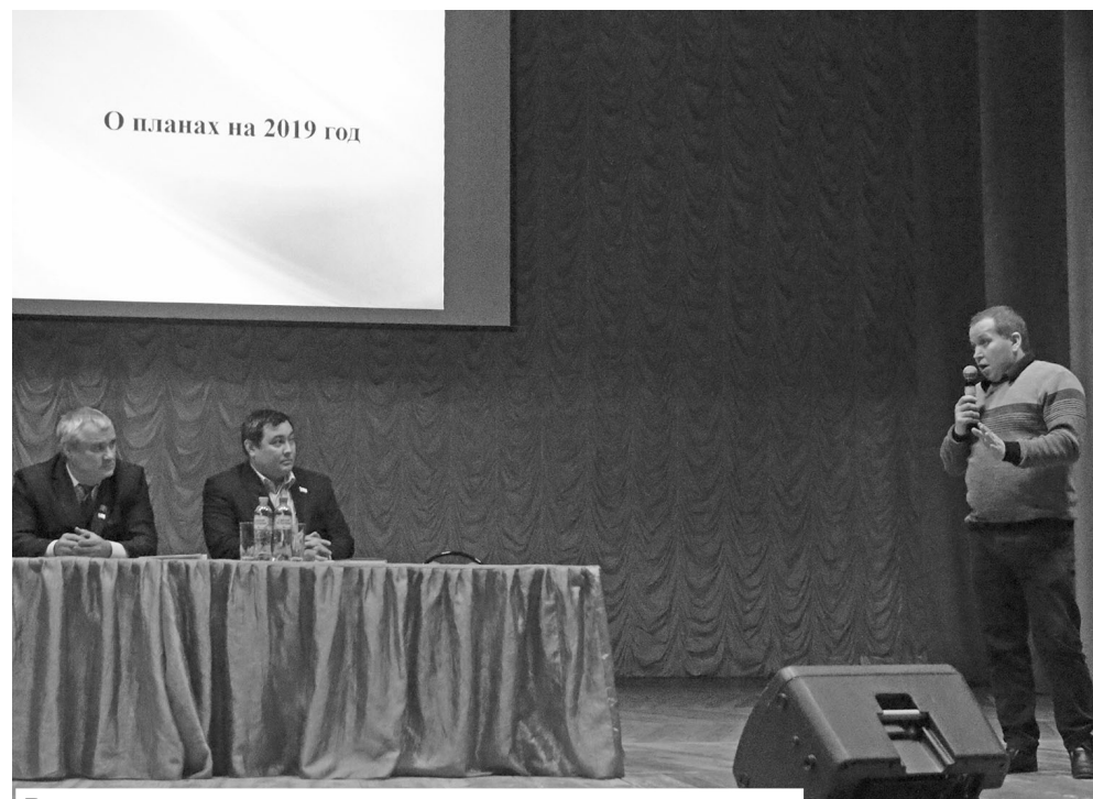
В завершение встречи жители задали свои вопросы

Подготовила Татьяна ПАВЛОВА