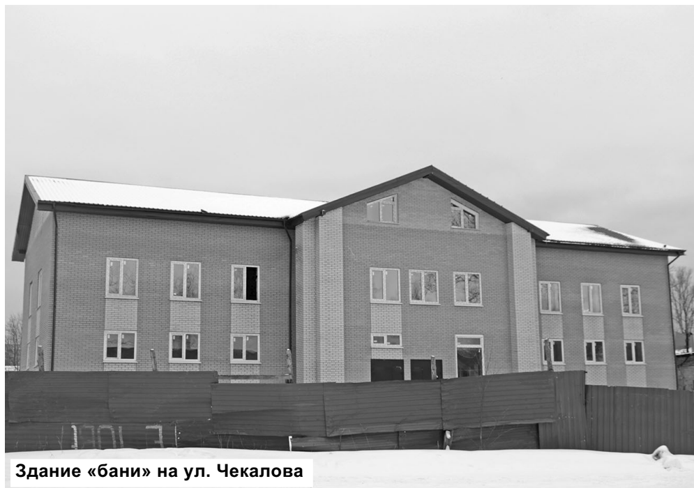
Здание «бани» на ул. Чекалова