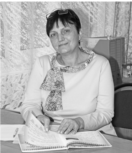
Родители и ученики 4 Г класса