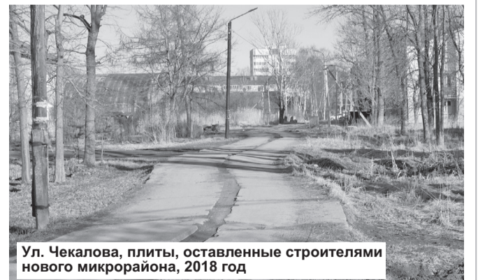
Ул. Чекалова, плиты, оставленные строителями нового микрорайона, 2018 год

найдётся решительный человек, который доведёт до конца работы, начатые 32 года назад, и вернёт улице Чекалова цивилизованный вид!