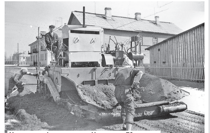
Укладка асфальта на ул. Чекалова, 70-е годы

Мы верим, что среди руководителей города