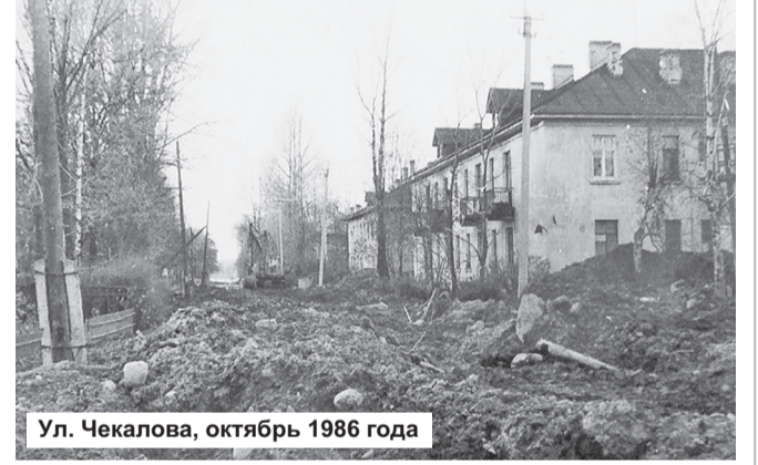
Ул. Чекалова, октябрь 1986 года