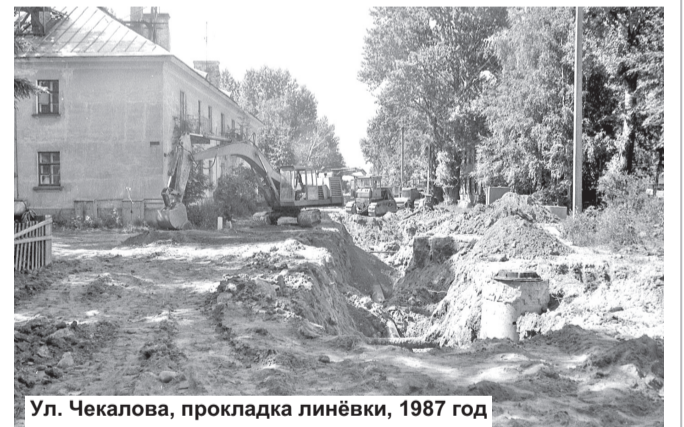
Ул. Чекалова, прокладка ливнёвки, 1987 год