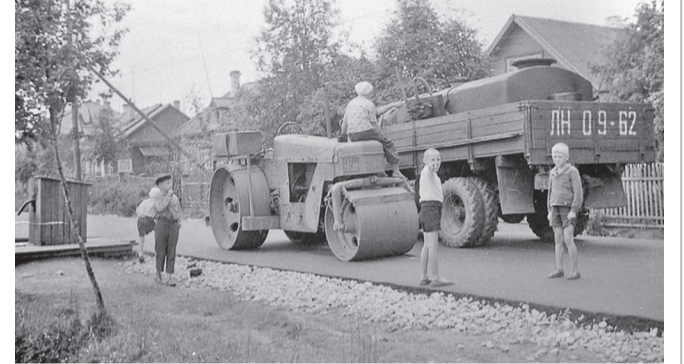
Ул. Чекалова, октябрь 1986 года