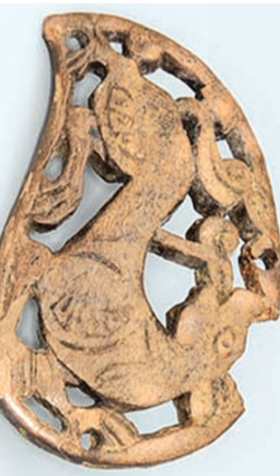
Инф. «НИ»

Выставка будет работать до 19 июля 2019 года. Посетить ее можно с 11:00 до 19:00 ежедневно, кроме вторника (11:00 – 18:00), среда – выходной день.