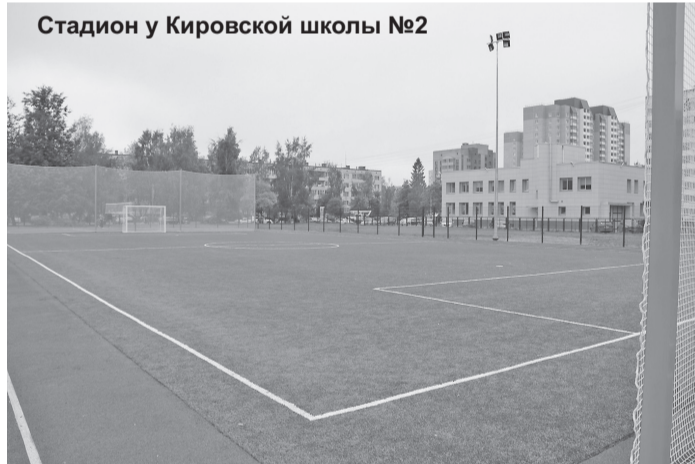
Стадион у Кировской школы №2