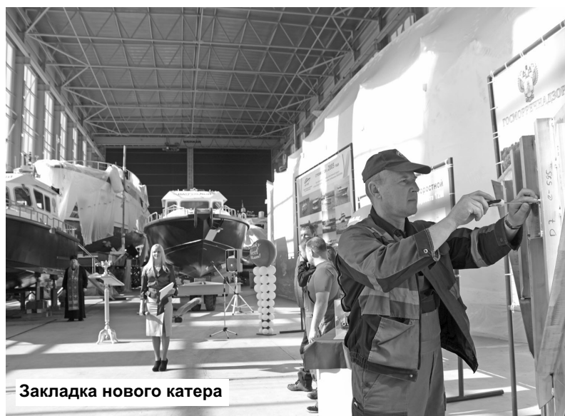
Закладка нового катера

Татьяна ПАВЛЕНКОВА