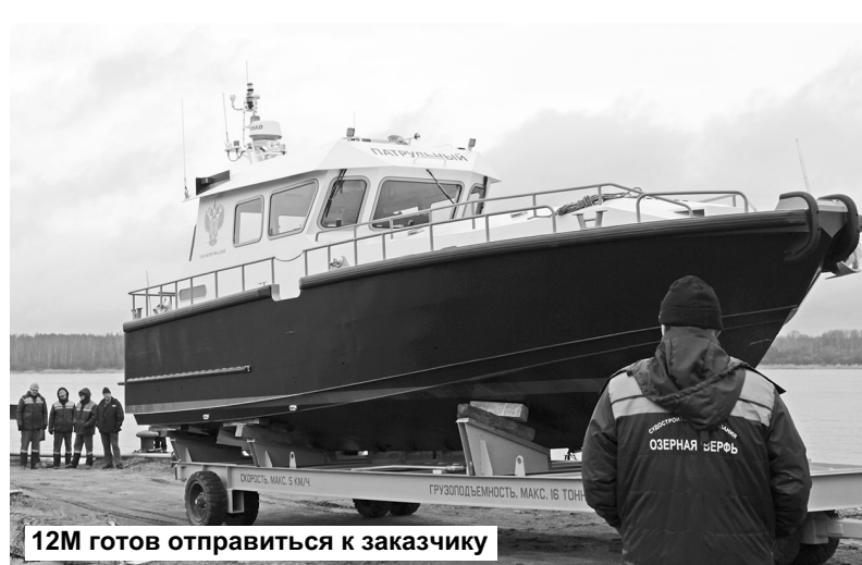
12M готов отправиться к заказчику