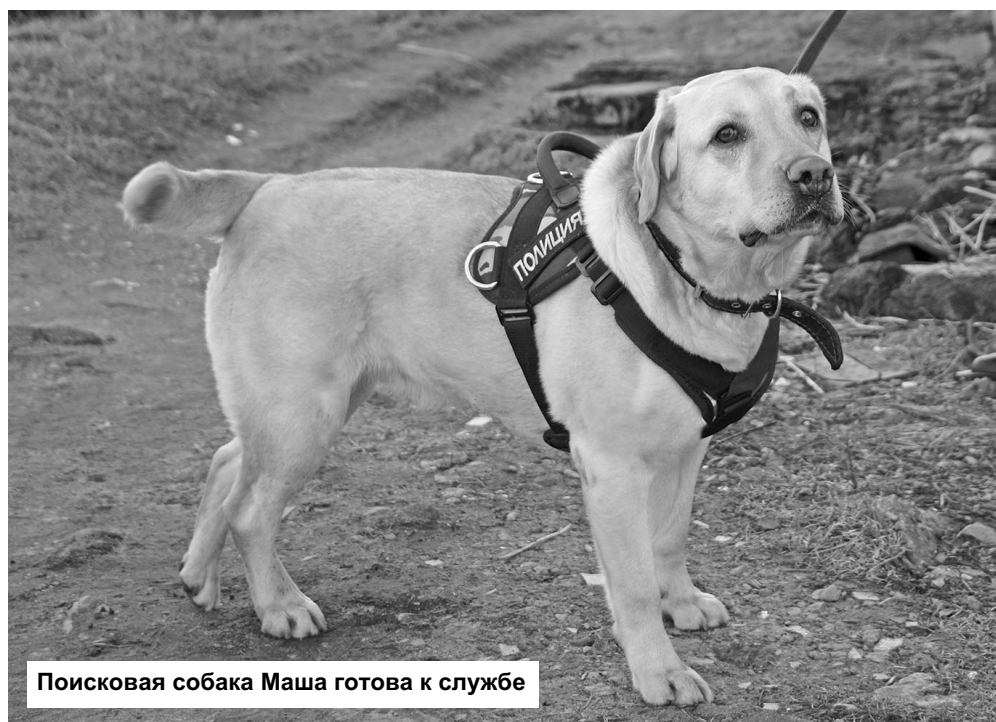
Поисковая собака Маша готова к службе