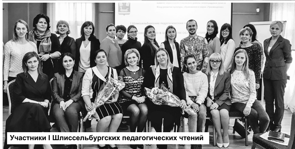
Участники I Шлиссельбургских педагогических чтений