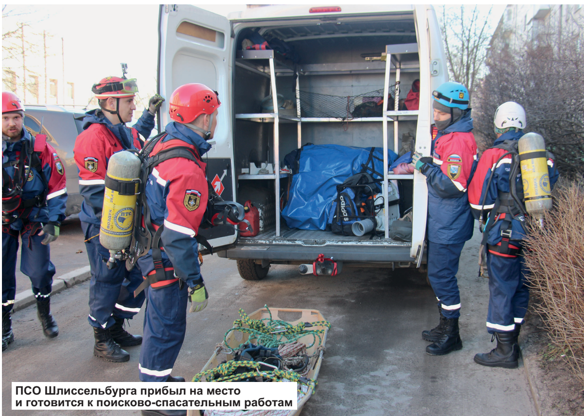
ПСО Шлиссельбурга прибыл на место и готовится к поисково-спасательным работам

2 апреля на территории Шлиссельбургской городской больницы прошли комплексные тактико-специальные учения по ликвидации последствий взрыва бытового газа. В них приняли участие органы местного самоуправления, службы экстренного реагирования, формирования постоянной готовности районного и городского территориальных звеньев подсистемы РСЧС (единой государственной системы предупреждения и ликвидации чрезвычайных ситуаций).