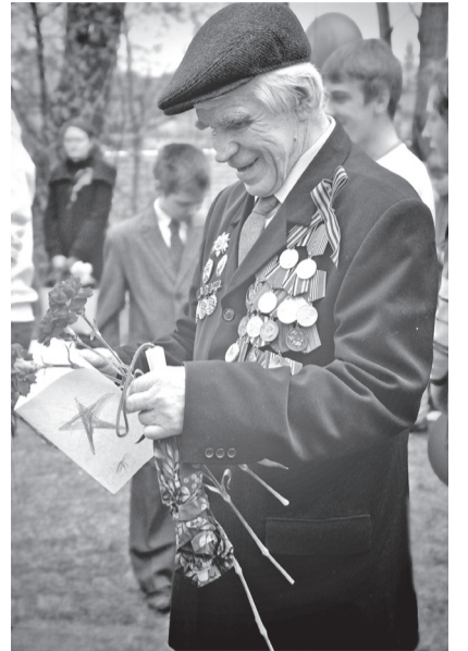
Подготовила Анна АРХИПОВА

Виктор Яковлевич – обладатель ордена Великой Отечественной войны II степени, медалей «За победу над Германией» и «За доблестный труд в Великой Отечественной войне», юбилейных медалей, а также 5 профессиональных наград. Но главной наградой в жизни считает семью: супругу, сына, внуков и правнука.