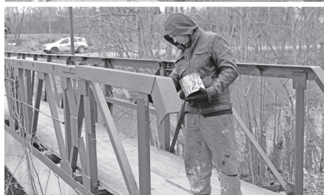
Замена деревянного настила и покраска ограждений моста через Староладожский канал у Ладожской речки