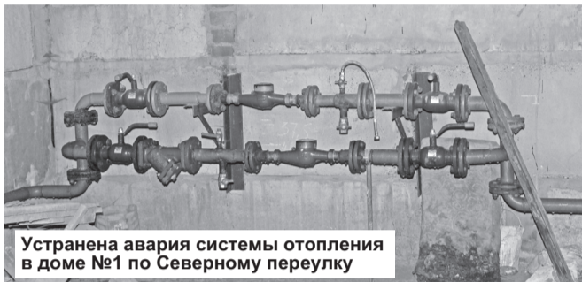
Устранена авария системы отопления в доме №1 по Северному переулку