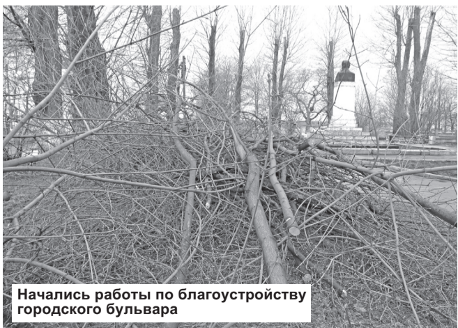
Начались работы по благоустройству городского бульвара