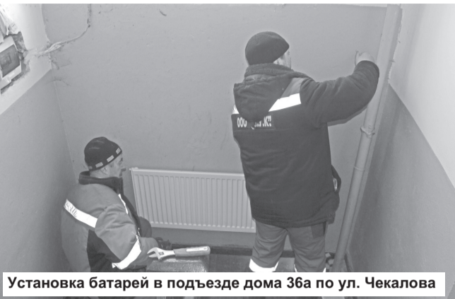
Установка батарей в подъезде дома 36а по ул. Чекалова

Записала Анна АРХИПОВА