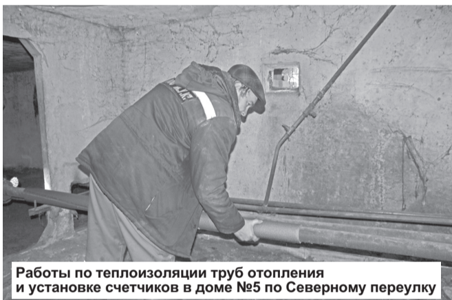
Работы по теплоизоляции труб отопления и установке счетчиков в доме №5 по Северному переулку