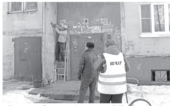
Частичное обновление фасада дома №18 по Малоневскому каналу