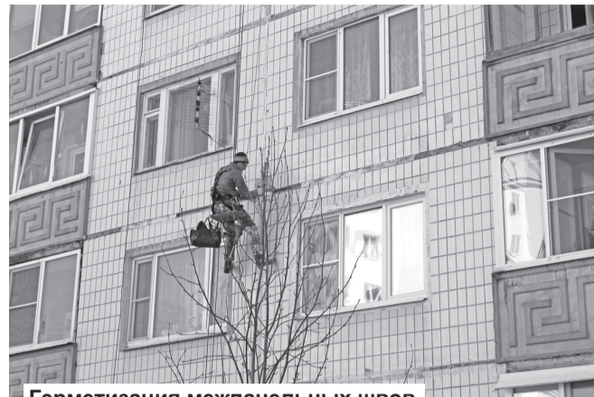
Герметизация межпанельных швов в доме №3 на Северном переулке