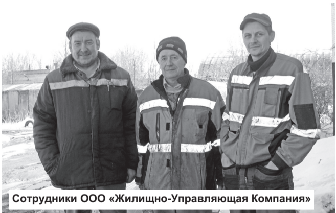
Сотрудники ООО «Жилищно-Управляющая Компания»