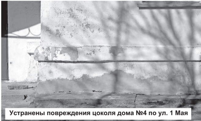
Устранены повреждения цоколя дома №4 по ул. 1 Мая