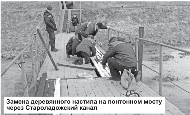
Замена деревянного настила на понтонном мосту через Староладожский канал