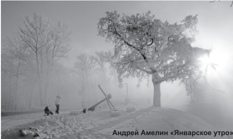
Андрей Амелин «Январское утро»