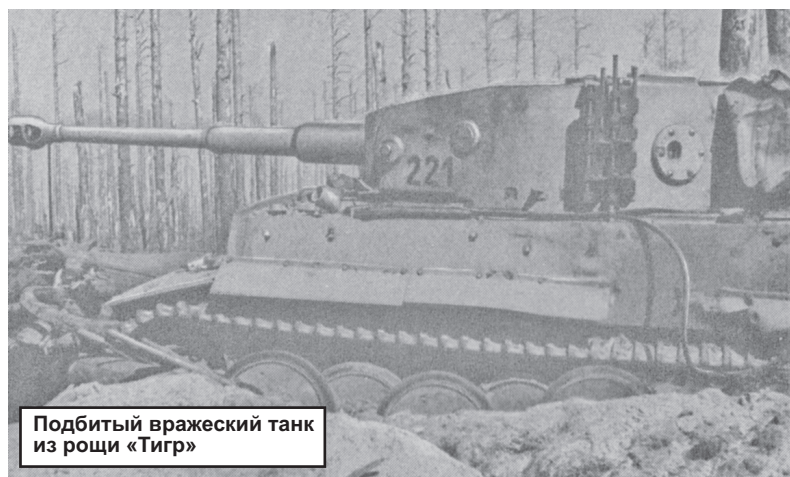
Подбитый вражеский танк из рощи «Тигр»