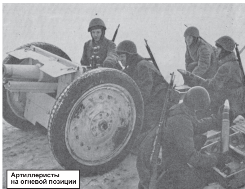
Артиллеристы на огневой позиции