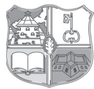
Шлиссельбургская городская библиотека им. поэта М.А. Дудина

Прием организован администрациями Кировского района и Шлиссельбурга в связи с обращением граждан на расширенном совещании об итогах социально-экономического развития Шлиссельбурга за 2016 год.