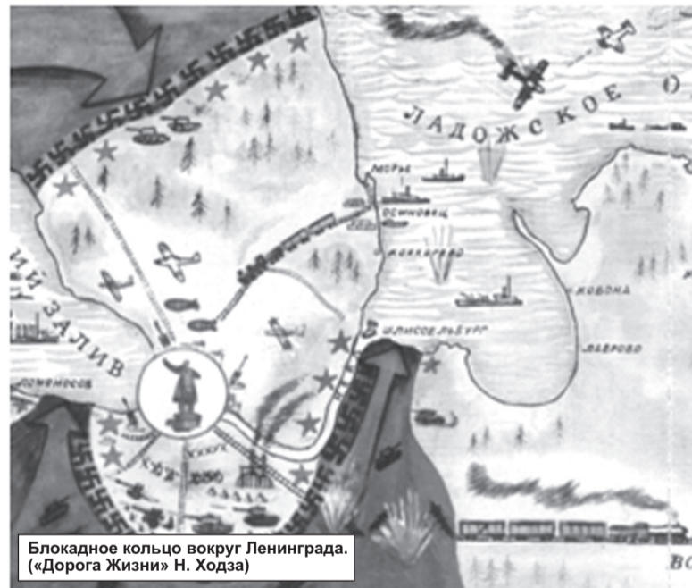
Блокадное кольцо вокруг Ленинграда. («Дорога Жизни» Н. Ходза)