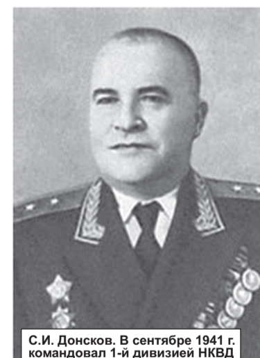
С.И. Донсков. В сентябре 1941 г. командовал 1-й дивизией НКВД

Правда, радость оккупантов, что город-ключ, которым они замкнули блокадное кольцо вокруг Ленинграда, находится у них в руках, будет недолгой. Вскоре фашисты полностью ощутят все прелести обладателя столь ценного для них «ключа». Уже несколько дней спустя начнутся первые попытки отбить город у врага. С 20 сентября до начала октября ежедневно будут проходить попытки высадить десант на Шлиссельбург со стороны Ладожского озера либо через Неву. До победного 18 января 1943 г. это будут не единственные попытки освободить Шлиссельбург. Кроме того по немецкому гарнизону Шлиссельбурга будут регулярно бить артиллерия, минометы и снайперы как с правого берега Невы, так и из крепости, находящейся у них под носом. О результате наших обстрелов и проводимых в городе диверсий против оккупантов как нельзя лучше свидетельствуют три кладбища немецких солдат, находившихся в Шлиссельбурге. Согласно данным коменданта