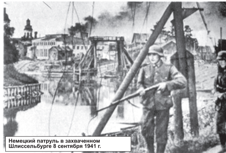
Немецкий патруль в захваченном Шлиссельбурге 8 сентября 1941 г.