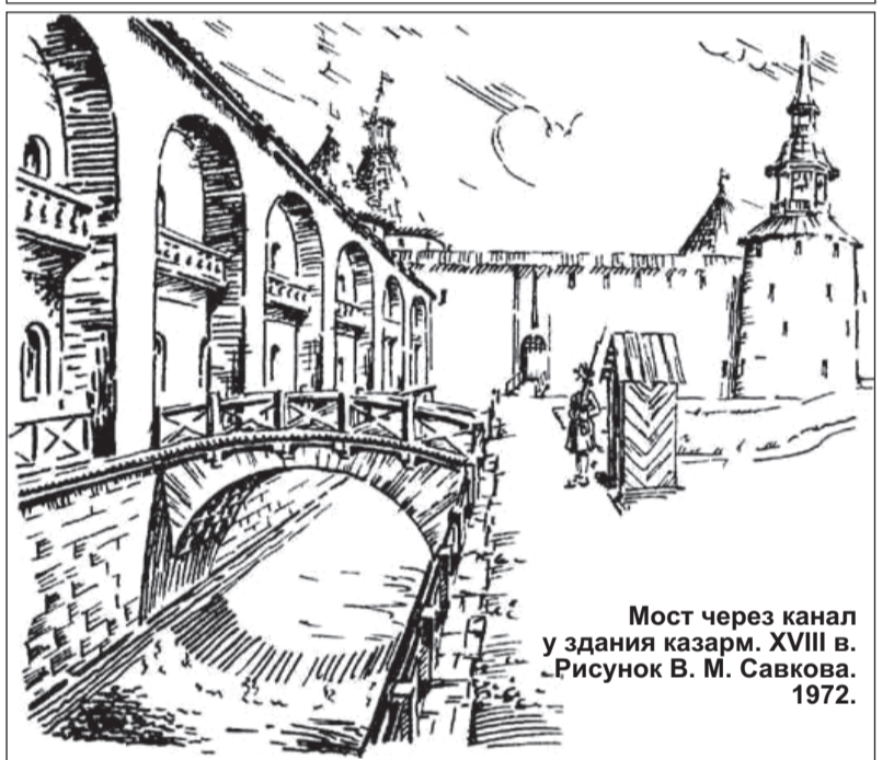
Мост через канал у здания казарм. XVIII в. Рисунок В. М. Савкова. 1972.

бурга, что и было сделано ночью 5 марта. В течение нескольких лет после мартовского пожара 1917 года большинство зданий Шлиссельбургской крепости не использовались и не ремонтировались, особенно плачевное состояние являли бывшие тюрьмы, наиболее пострадавшие от пожара. В первом тюремном корпусе сгорела крыша, потолочные и межэтажные перекрытия, значительные участки стен отстояли друг от друга и угрожали падением, в здании была испорчена кирпичная кладка карнизов, оконных и дверных откосов, выгорели оконные рамы, были разрушены ступени на лестничных клетках, побиты плиты полов первого этажа. Долгое время строения крепости не были взяты под охрану, лишь 25 сентября 1925 года в Шлиссельбургскую крепость для обследования состояния памятников выехала комиссия в составе представителей партийных и политпросветительских учреждений и общества политкаторжан. Комиссия пришла к заключению о необходимости включить в число охраняемых зданий два этажа первого тюремного корпуса и наметила предварительные меры по приведению крепости в музей. Первый корпус планировалось покрыть крышей и восстановить камеры.