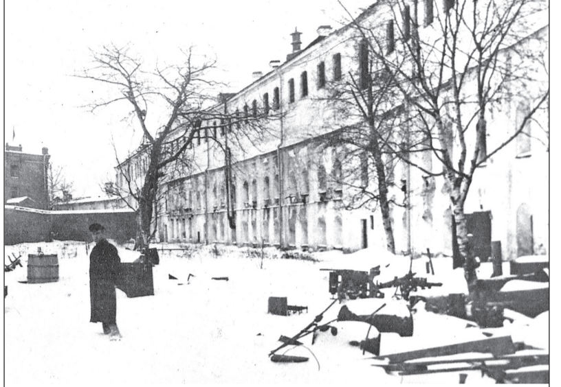
Первый тюремный корпус (бывшие «нумерные» казармы). 1909–1917.

В 1917 году, по решению Петросовета, все узники Шлиссельбургской тюрьмы были освобождены. Революционный комитет Шлиссельбургского порохового завода принял решение сжечь тюремные здания Шлиссель-