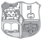
Шлиссельбургская городская библиотека им. поэта М.А. Дудина