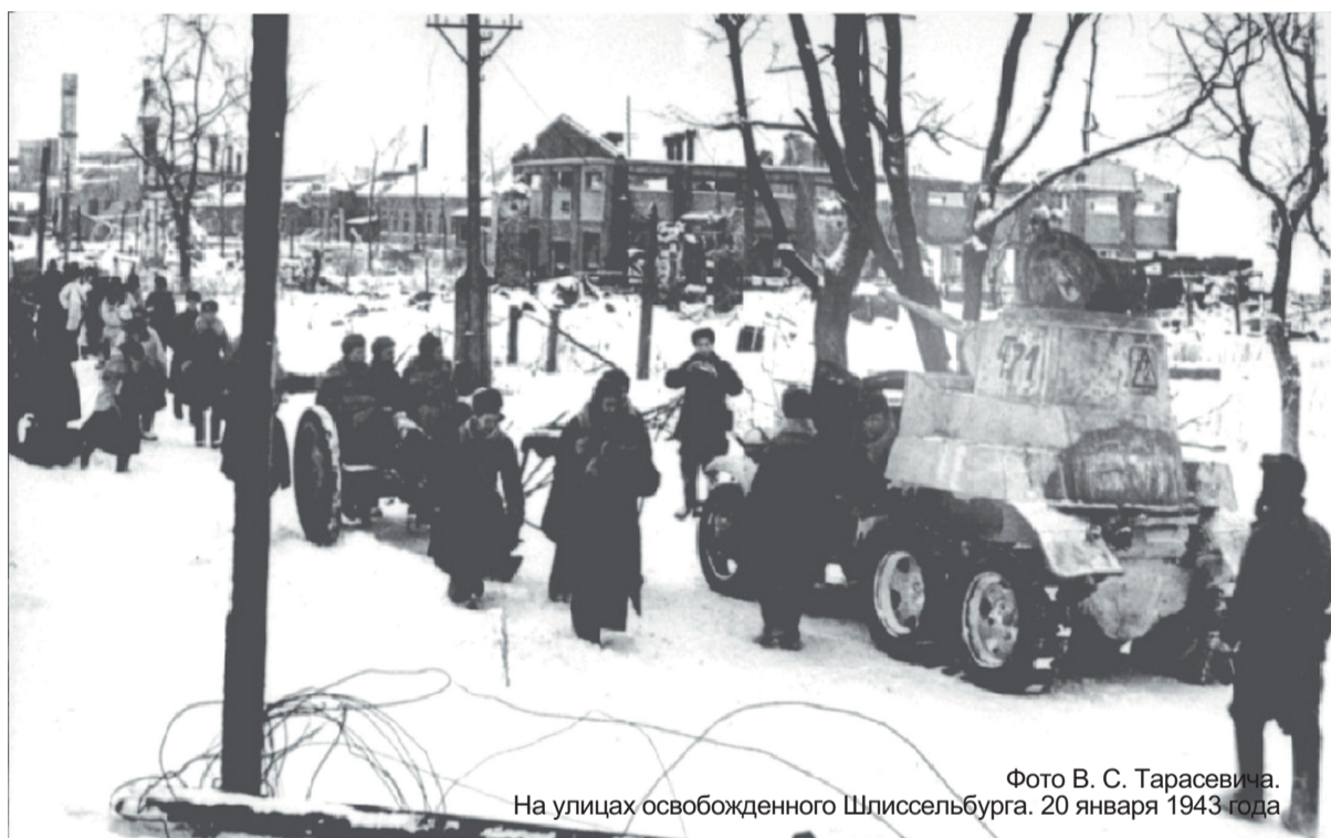
На улицах освобожденного Шлиссельбурга. 20 января 1943 года

75 лет назад блокада Ленинграда была прорвана. Наш город не случайно ежегодно вспоминает это событие – закончились 498 дней оккупации. На городском собрании развевался красный флаг. Напротив города через Неву началось строительство свайно-ледового моста знаменитой и страшной Дороги Победы.