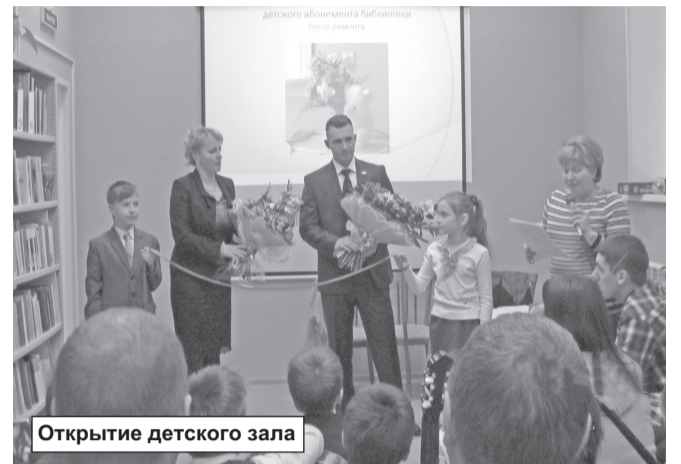
Открытие детского зала

Тел. : 8 (81362) 74-428, e-mail: biblshl@yandex.ru