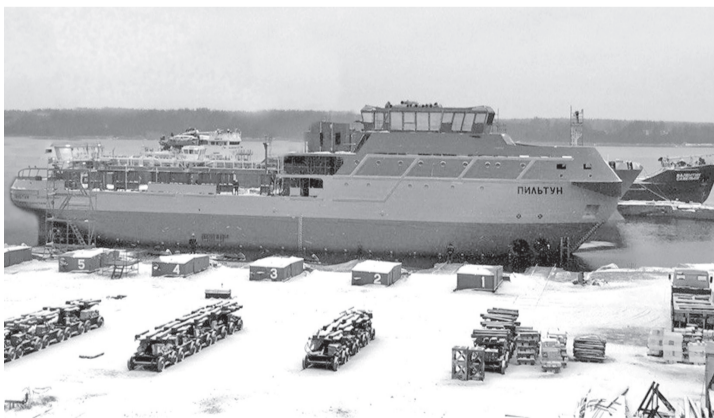
Соб.инф. Фото предоставлено НССЗ

Судам проекта MPSV12 присвоены имена по названию рек, расположенных в районах портов приписки и эксплуатации этих судов. «Пильтуном» буксир назвали по названию реки на острове Сахалин, которая впадает в одноименный залив Охотского моря.