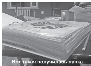
Вот такая получилась папка